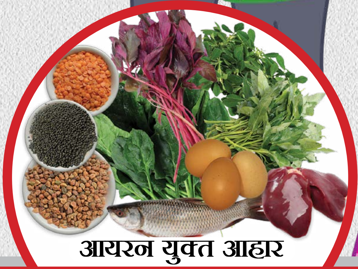
आयरन युक्त आहार