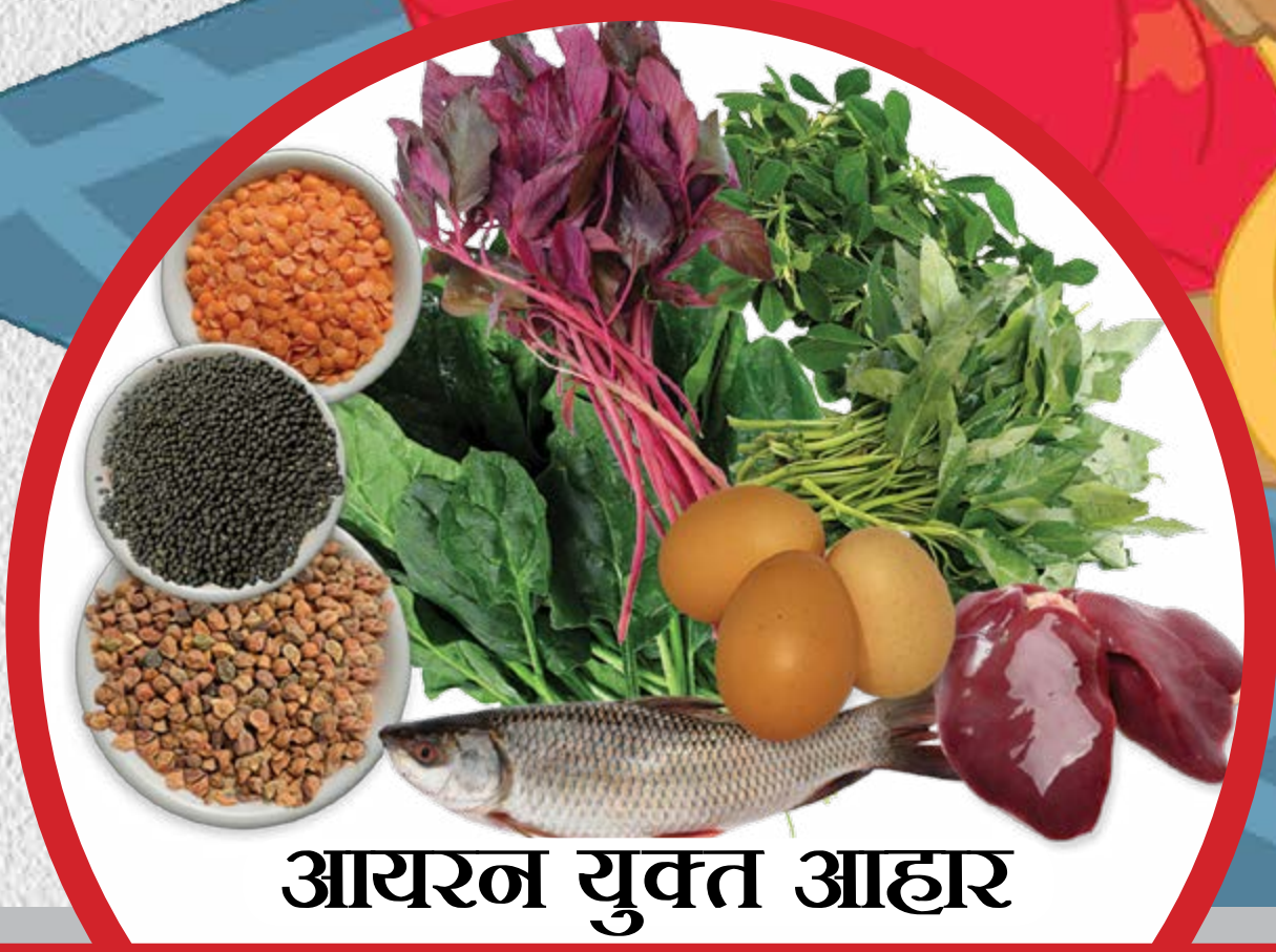
आयरन युक्त आहार

धात्री महिलाएं चाहिए स्वस्थ शरीर और तेज़ बच्चा?