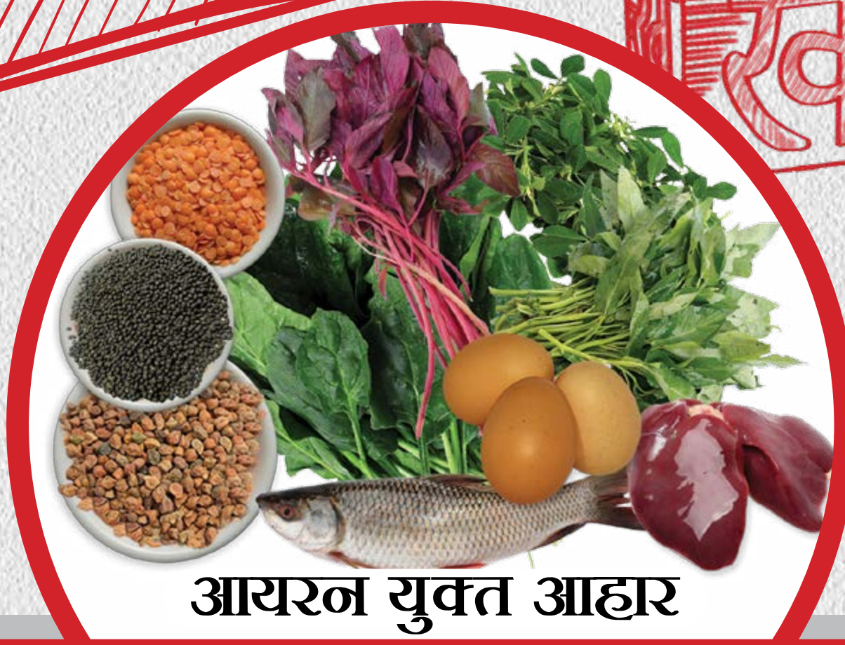
आयरन युक्त आहार