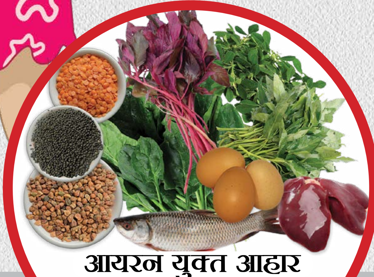
आयरन युक्त आहार

5 से 9 साल लड़के और लड़कियाँ वाहिए स्वस्थ शरीर और तेज़ दिमाग?